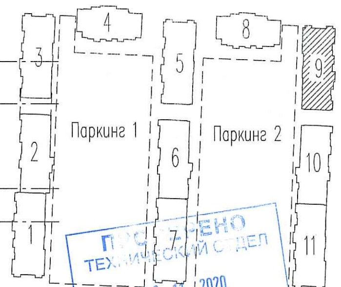
Схема расположения секций

ПРОЕКТНО-ТЕХНИЧЕСКИЙ ОТДЕЛ 09.11.2020 СОТРУДНИК ТО