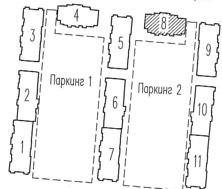
Схема расположения секций

Инв.№ подл. _____ Подп. и дата _____ Взам. инв.№ _____